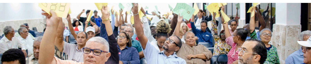
Delegados/as Asamblea Anual Foro Ciudadano 18 marzo 2023

CIPROS agradece a Ciudad Alternativa, Centro Juan XXIII, Centro Montalvo, IDEAC, Fundación Solidaridad, ACOPRO, Participación Ciudadana, Red Urbano Popular, Coop Hábitat, Observatorio de Políticas Públicas de la UASD, COPADEBA, CIPAF el compromiso para fortalecer a Foro Ciudadano participando activamente en el Comité de Seguimiento y Comité Colegiado como instancias de construcción democrática de Foro Ciudadano.